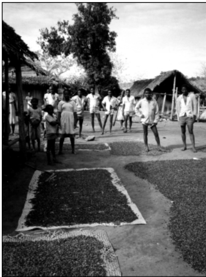
Sušenje kave na Madagaskarju

Za rižem pride na vrsto kava. Obiranje malih rdečih jagod, zelo podobnih tistim pri bodičju, je kaj zamuden posel. Potem jih je treba še oluščiti. To naredijo tako, da jih najprej stolčijo v lesenih koritih, potem posušijo in na koncu očistijo. Za 26. junij, malgaški narodni praznik, je jedače in pijače dovolj. Slednja je na žalost največkrat v obliki "toaka", malgaškega žganja, pripravljenega iz sladkornega trsa in banan. Še huje je, kadar imajo tradicionalni družinski praznik. Ti so v času riža in kave zelo pogosti. Najpomembnejša sta "fora" (o se bere kot u), kar pomeni obreza in "andry faty" dnevi spomina na umrle prednike. Obrežejo vse