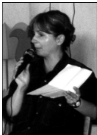
Ob obisku pisateljice