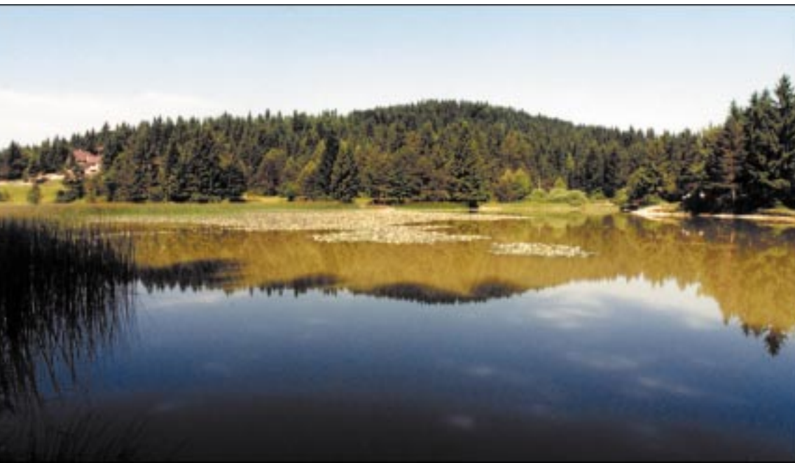
Bloško jezero, ko cvetijo lokvanji

Nadaljevanje s 1. strani tem je bilo potrebno pripraviti ustrezno dokumentacijo, kot so statut in program dela. V soboto, 3. junija, se je na ustanovitvenem