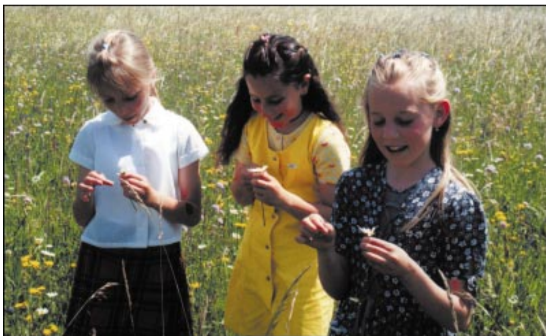
Devet pomladi štejemo...

Veselo praznovanje dneva državnosti vam želi uredništvo.