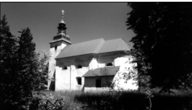
Cerkev sv. Urha

Ta cerkvica je bila nekoč grajska kapela pri Auerspergovem gradu Nadlišek. V tem gradu je v času protestantizma bival Jurij Dalmatin, prevajalec Svetega pisma, pozneje pa se je tu večkrat zadrževal Valvasor in prav tu videl bloške smučarje, kar je nato opisal v Slavi vojvodine Kranjske. V tej knjigi je tudi ugotovil, da so Bloke geografsko središče Kranjske in navaja, "kar sam sem izmeril".