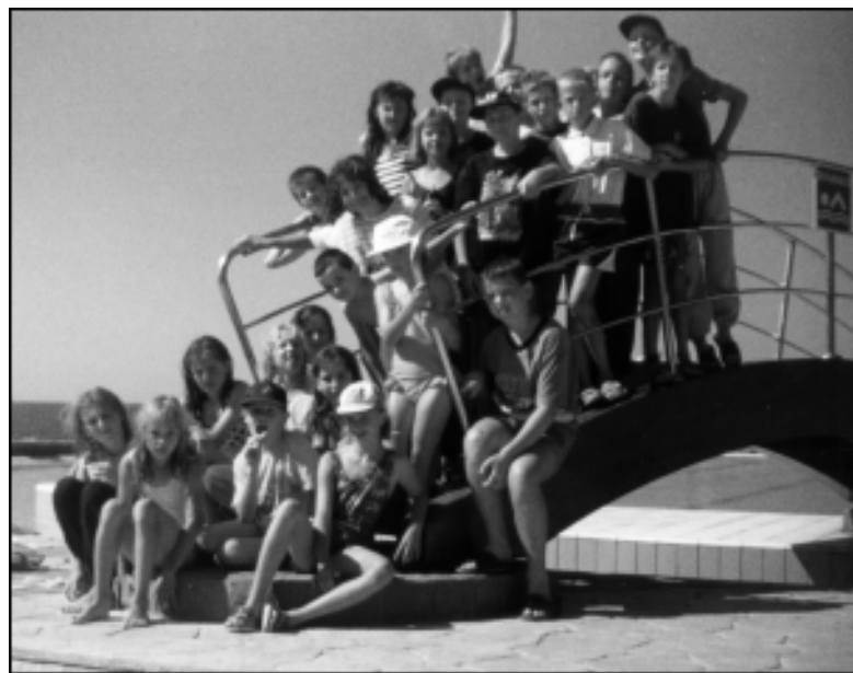
Najlepši del šole v naravi: vožnja z barko