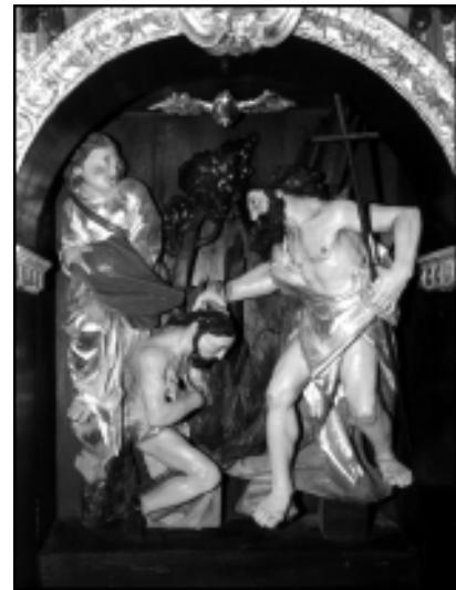
Oltar Janeza Krstnika na Studenem