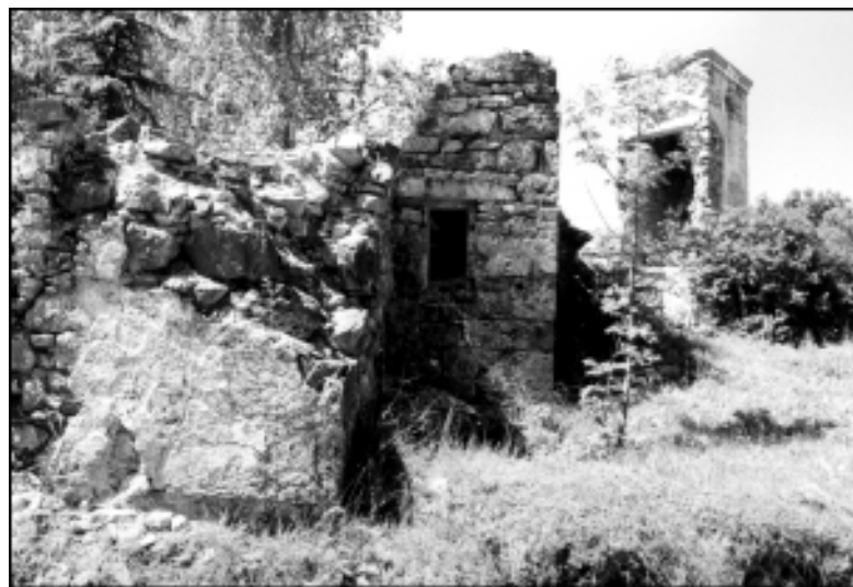
Ruševine pajkovega gradu

Cerkev sv. Urha ima tudi zelo stare zvonove. Večji nosi letnico 1382, mali pa 1355 in je verjetno med najstarejšimi v Sloveniji. Manjši je počen in ne zvoni več. Po ustnem izročilu naj bi ga dala "ubiti" ena od grajskih gospa, ker je ob močnejšem vetru sam od sebe brnel in s tem motil to "fino" gospo