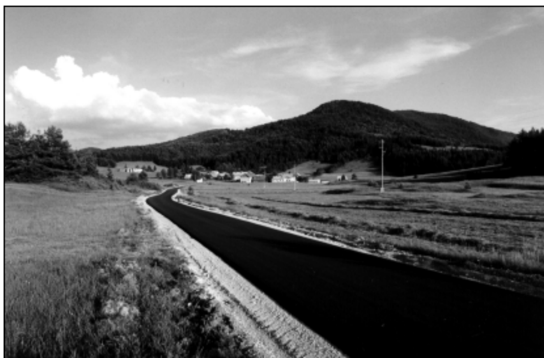
Topol je dobil tudi krajšo pot do Nove vasi