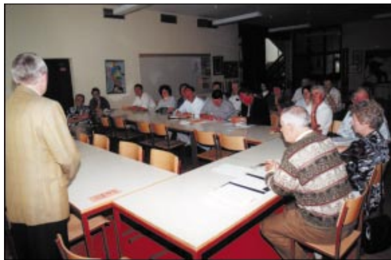
Na ustanovnem občnem zboru

asociacija vpeta v družbena dogajanja in naj bi tudi v bodoče predstavljala pomemben koordinatorski pri gospodarskem, družbeno-kulturnem ali prostorskem načrtovanju.