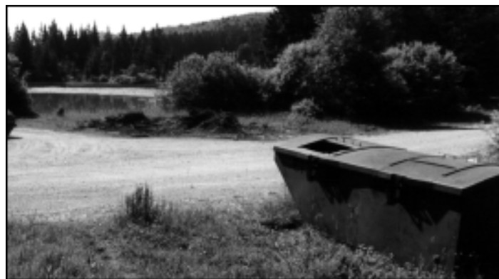
Okolica Bloškega jezera ponekod bolj spominja na smetišče kot pa na turistično-rekreativno površino.

Bloški korak dobivajo vsa bloška gospodinjstva zastoj. Nekaj sto izvodov pa pošiljamo tudi Bločanom, ki živijo drugod. Če bi še kdo želel prejemati glasilo, naj sporoči svoj naslov.