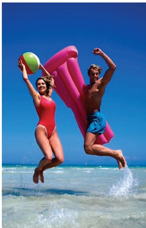
Pazite se sonca in vročine