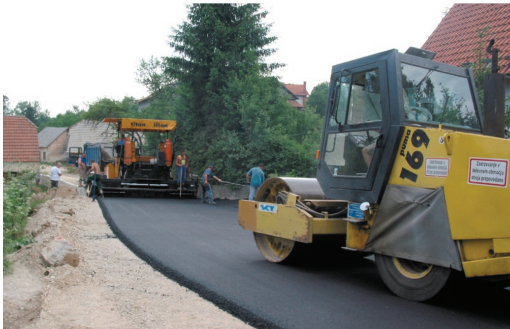
Letos bo urejenih in asfaltiranih okrog 6 km cest: na sliki dela v Ravniku.

Pri izdelavi prostorskega plana smo imeli v vidu tudi potrebe razvoja gospodarstva. Na novo smo predvideli dodatna zazidljiva