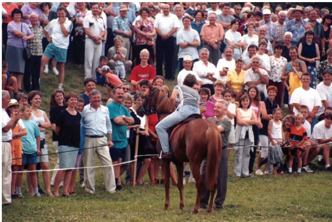
Konji so vedno velika zanimivost na kmečkih igrah. Obiščete jih lahko tudi 27. julija letos.