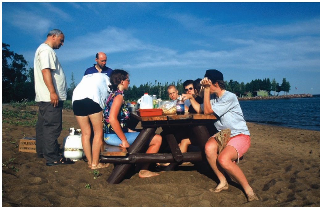
Javna piknik miza in pire iz mleka, katerega liter je veljal kar petsto dolarjev!

Res impresivnih vtisov z Niagarskih slapov, teh ogromnih količin vode, ki grmi v globočino, se preprosto ne da opisati. Voda, ki s svojo močjo vsako leto pomakne prepad za sedem centimetrov nazaj, je nekaj nepojmljivega. In kot taka že od nekdaj buri človeško domišljijo. Vsake toliko se najde kdo, ki si izdelava plovilo in se v njem »za-