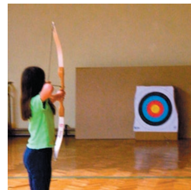
Streljali smo z lokom