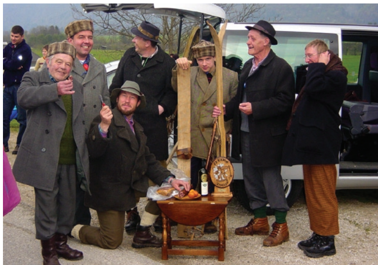
Bloški smučarji so poskrbeli za zabavo drugih smučarjev