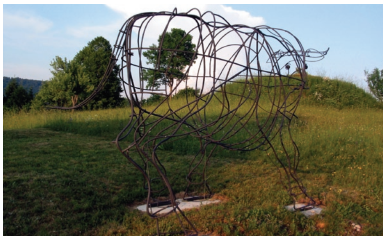
Spomin na bloškega vola

slikarju Mišu Strmanu, je ta zastavil resnejši projekt. »Ideja se mi je zdela zanimiva, ker pa sem želel storiti še nekaj več, sva se z Jožetom odločila za pravo skulpturo vola,« pravi Mišo, ki še ni imel izkušnje s tovrstnim, žičnim ustvarjanjem. Najprej je napravil model iz bakrene žice, za katerega je priznal, da ga je bilo težje narediti, kot potem zvariti pravega. Za zanimivost naj zapišem, da je bilo za model ve-