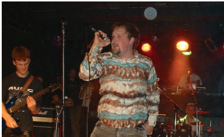
V K4 je Bloke predstavljala domača zasedba Lex Universalis

Poleg teh dogodkov pa so bili ves čas prisotni tudi redni filmski večeri,