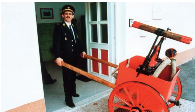
Predsednik je od danes – črpalka pa izpred sto let

Gasilci pa nimamo le vaj. Letos se je na Bledu odvijal tudi kongres GZ Slovenije. Pomemben dogodek je