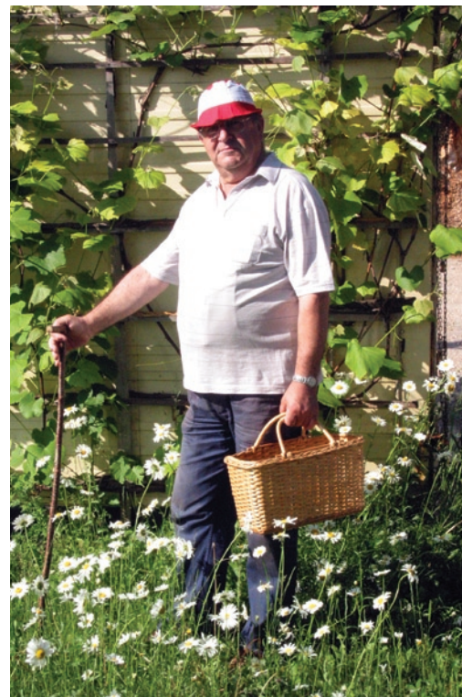
Nabiranje gob po gozdu mi je veliko veselje

Upokožil se je in se vrnil v Slovenijo, ampak vrnitev v Slovenijo zanj ni bilo dovolj. Ker je Bločan z dušo