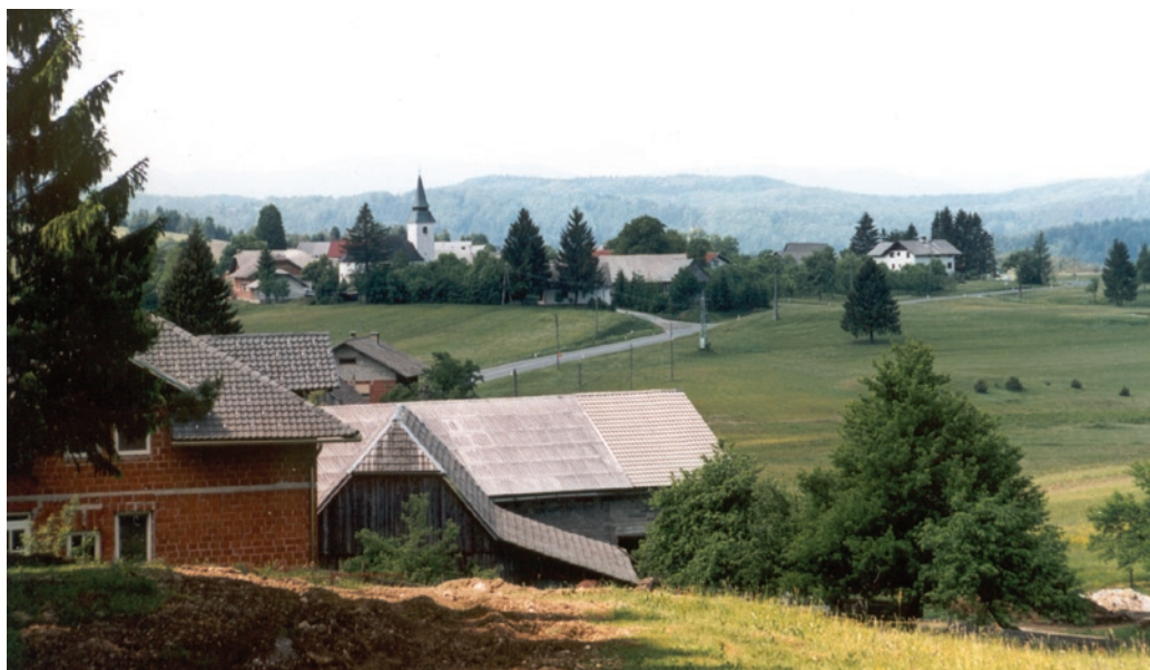
Runarsko, junija 2003

Marijinega rojstva. Pokopališča ob njej menda ni bilo nikoli, umrle Runarce in Runarke pa še vedno pokopavajo na pokopališče ob cerkvi pri Fari. Tudi šole in trgovine v vasi menda ni bilo nikoli, Klobasarjevo gostilno in Klobasarjev sifon pa so poznali daleč naokoli vse do sredine pet-