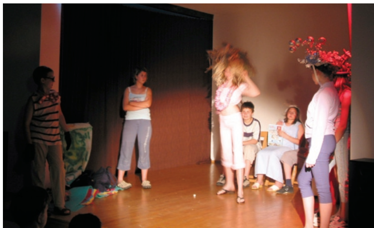
Počitnice so nam predčasno pričarali igralci iz Velikih Lašč

Kot vidite, je BOŠ v polnem zagonu, mladina se prebujala. Vsi tisti, ki ste morda še v dvomih, da bi se nam pridružili, nikar ne premišljuje, samo enkrat si mlad in škoda bi bilo, da ne bi izkoristili možnosti, ki so vam ponujene.