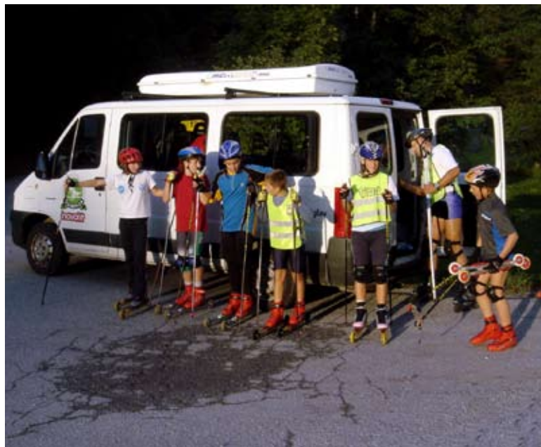
Mladi tekmovalci se pripravljajo na trening.

življenja, vendar na drug način kot nekoč in da se bo spet govorilo, da na Blokah smučajo. Pa ne samo en dan v letu.