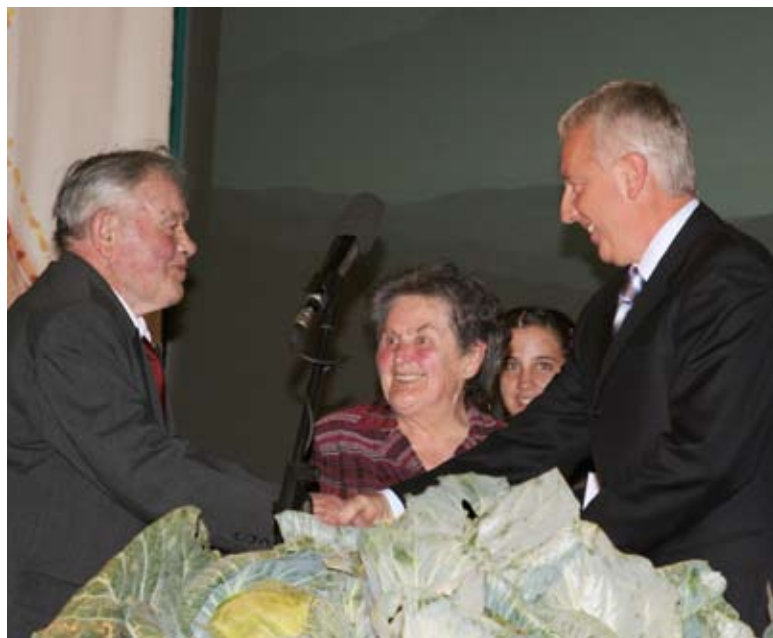
Petračeva s Hudega Vrha

»Vesel in ponosen sem na to priznanje, ki mi veliko pomeni. Vesel sem, da sem z vami dosegel velike, sorazmerno dobre rezultate. Istočasno pa me to priznanje zavezuje za naprej, da bom z vami, posebno pa z županom, imel prijetne odnose in da bomo naprej gradili bloško prihodnost.«