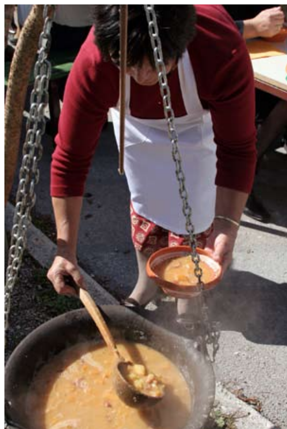
Če ste si kupili kavo, ste jo dobili v originalni lončeni skledici.

mlade pujske in enega kozla. Vsi so žalostno ždeli v pokritih avtomobilskih prikolicah. V bližini je rezgetalo nekaj konj, ki pa po večini niso bili namenjeni za prodajo. Predstavitev večjih podjetij iz Blok, ki je potekala na drugem delu sejmskega prostora (na parkirišču med zdravstvenim domom in pošto), je sejem pokazala iz zornega kota sedanjosti. Domiselno postavljene razstavne prostore je žal kazila stojnica s kičem oz. ceneno kramo v neposredni bližini. Žal je danes splošno razširjeno mnenje, da sejma ni brez novodobnih kramarjev, mislim pa, da bi bil bloški sejem uspešen tudi brez takšnih stojnic. Kvaliteten bloški izdelek se pač ne more primerjati z izdelki množične izdelave iz tujine. Ponudba suhe robe