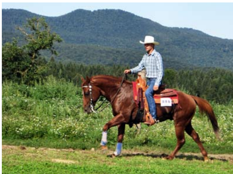
Tipična western ježa

Skupni interesi in želja po organiziranem delovanju so botrovali temu, da je bilo leta 1998 ustanovljeno Slovensko združenje quarter konja (SIQHA), ki se je letos pridružilo krovni organizaciji za konjenišvo v Sloveniji, Slovenski konjeniški zvezi (KZS). SIQHA združuje rejce in lastnike konj pasme quarter, paint in appaloosa ter tekmovalce v vseh western disciplinah. Njihov primarni cilj je organizacija slovenske reje konj pasem quarter, paint in appaloosa ter predstavitev teh pasem širši javnosti. Leta 2007 je bilo ustanovljeno še Slovensko združenje western jahanja (SZVJ), ki prav tako združuje rejce, tekmovalce in lastnike ter daje poudarek western disciplinam, predvsem reiningu, poleg tega pa podpira sodelovanje konj vseh primernih (ne samo ameriških) pasem na takšnih tekmovanjih.