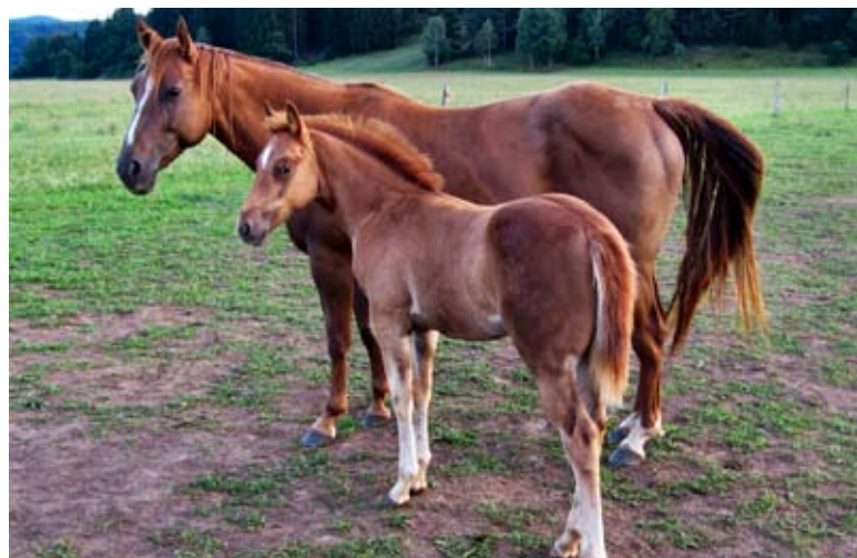
Na Blokah raste mladi rod slovenskih western konjev.