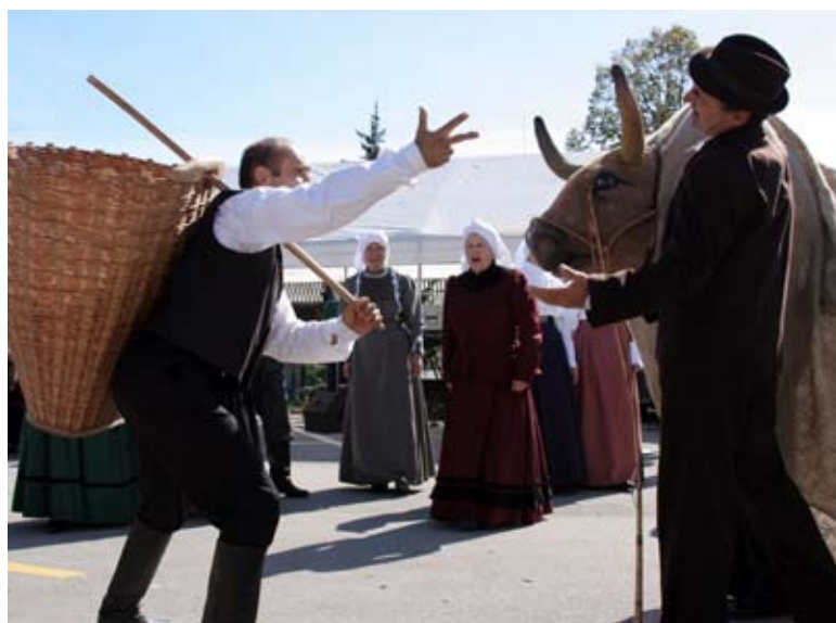
Program je popestrila folklorna skupina z Rakeka, tudi z originalnimi sejmarskimi plesi.