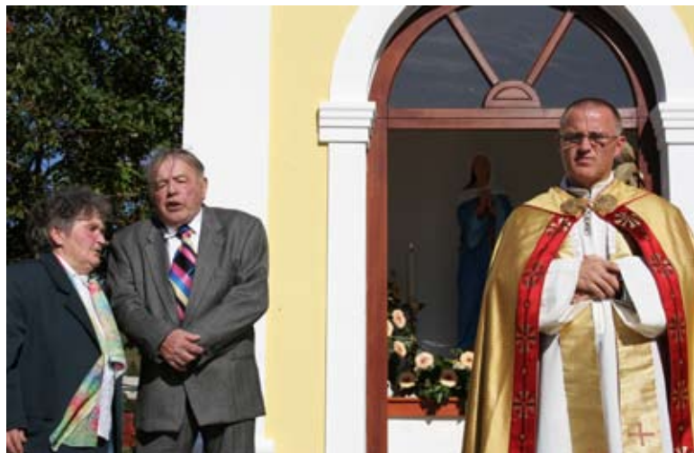
Novo vas bo sedaj krasila tudi obnovljena Blaževa kapelica.

tanovljene kmetijske zadruge, preko katerih je potekala prodaja.