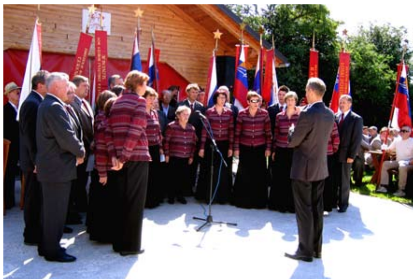
Na proslavi je pel mešani pevski zbor Bloke.

d. d. Lož, Krajevna organizacija Zveze borcev Bloke in Gasilsko