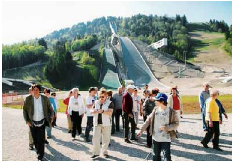
Pod skakalnico v Garmischu

je zgrajen veličasten dvorec Ludvika II. – kopija francoskega Versaillesa. Grad je obdan s prelepim parkom in fontanami – vodometi, v notranjosti pa med razkošnimi dvoranami izstopa predvsem posebna in zares čudovita zrcalna dvorana.