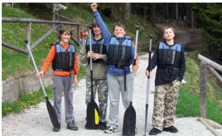
Bili smo v šoli v naravi – Javorniški Rovt