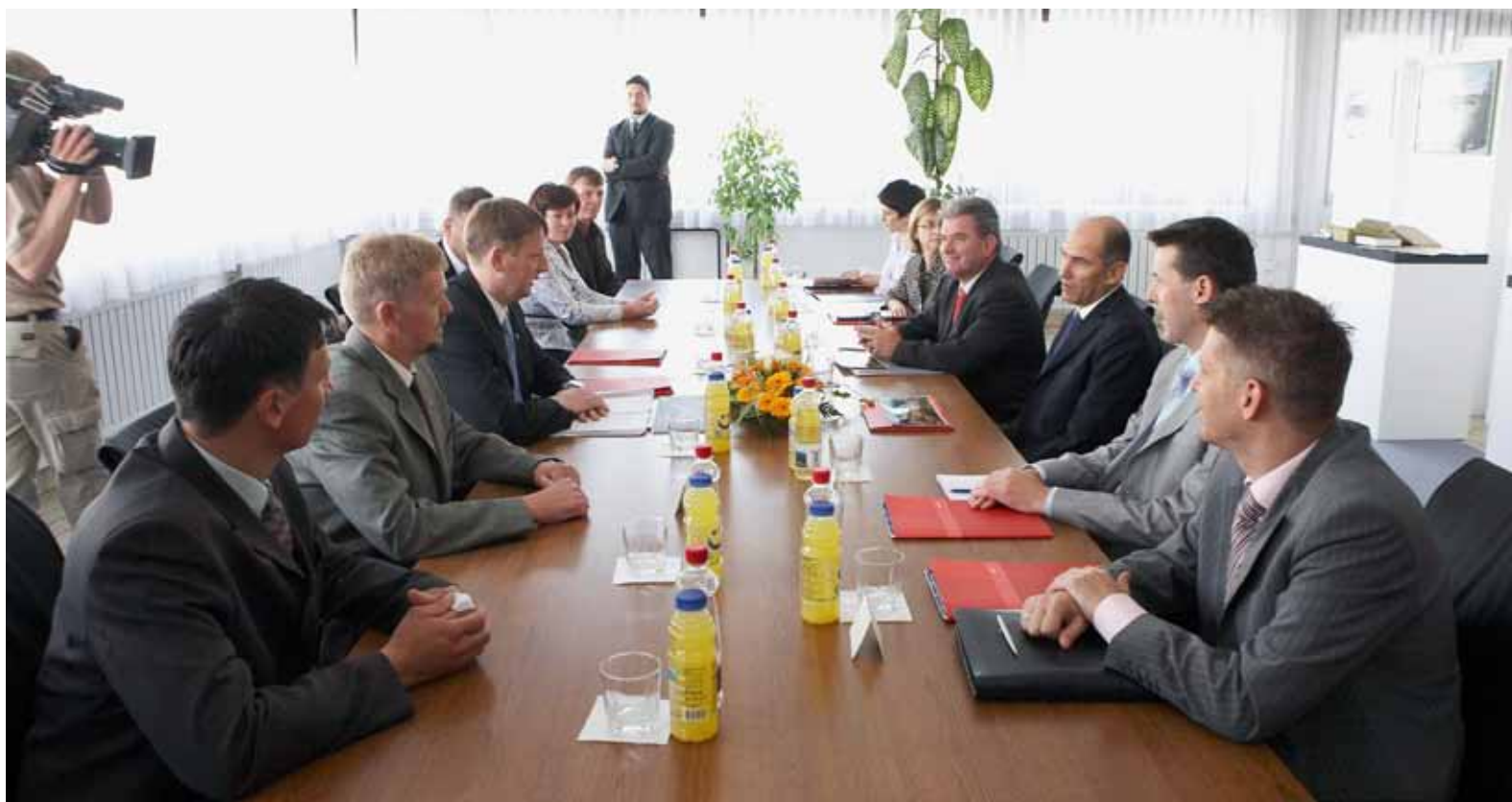
Delovni razgovor v Novolitu

Kot širšo problematiko, za katero bi želeli, da jo država oz. vlada pomaga reševati v dobro kraja, kjer živimo in delamo, pa je bila izpostavljena potreba po modernizaciji in posodobitvi cest. Ceste so tisti predpogoj nemotene pretoka blaga in ljudi, ki omogoča razvoj kraja in regije. Kot prioriteto smo izpostavili povezavo z Ljubljano, v smeri Velikih Lašč, ki je najkrajša povezava do prestolnice. Poleg tega pa je za nadaljnje »odpiranje« Bloka, Cerknice in Loške doline nujno potrebno čimprej modernizirati ceste (tudi