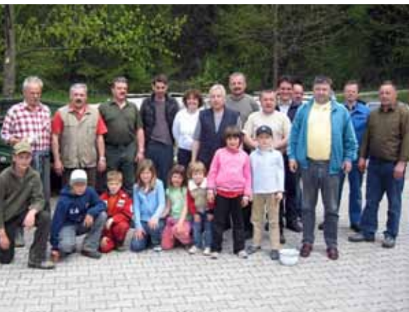
Polovica udeležencev čistilne akcije 08