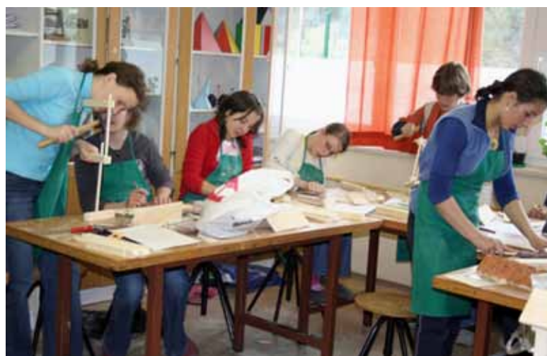
Izdelovali smo kozolce.