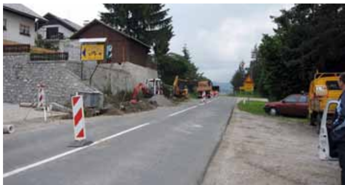
Dela skozi novo naselje v Novi vasi so zahtevna.