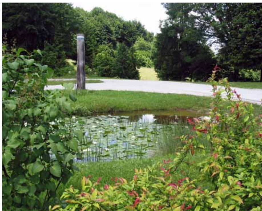
Luža je okras Lužarjev.

Iška tesen po kateri teče istoimenski potok, ki je njen graditelj in oblikovalec, ni povsem prelomnega nastanka, temveč je nastala tudi z delovanjem površinske (vadozne) vode. Iški potok pride na dan v treh izvirih, pod cerkvijo sv. Ožbalta, pod vasjo Lužarji in pod robom Bloške planote. Voda je kot odlično topilo poiskala vse napake v tukajšnji matični karbonatni kamnini triasne starosti (200 do 250 milijonov let), ki so bile manj odporne, jih delno stopila, delno pa odnesla in tako počasi v geološki zgodovini ustvarila globoko in ostro tesen. Napake v matični kamnini so nastale tudi zaradi delovanja gorotvornih (orogeneznih) sil. Delovanje površinskih voda se je najprej kazalo v denudaciji (ogolitvi) in nato še v eroziji (izpiranju) ozemlja. V padavinskih obdobjih pa še številni pritoki in pritočki pomagajo odvajati vodo s strmih bregov in bogatijo Iško. Ob »hudih urah« ne nadoma oživijo razdiralni hudourniki, vendar kontrolirano odvajajo v zelo kratkem času nabrano vodo iz strmih sten v stalni iški vodotok. Slekoprej pa vodotok doseže neprepustne kamnine, oblikovanje tesni se zelo upočasni, vendar ne preneha, temveč oblikuje