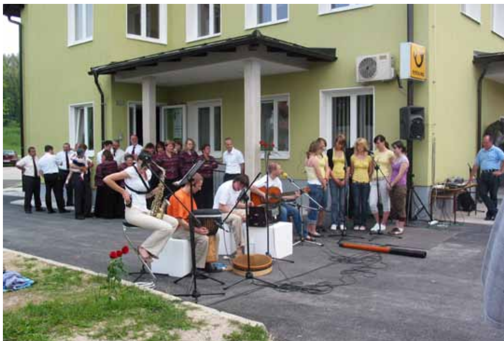
Odprtje knjižnice je za Bloke lep kulturni dogodek.