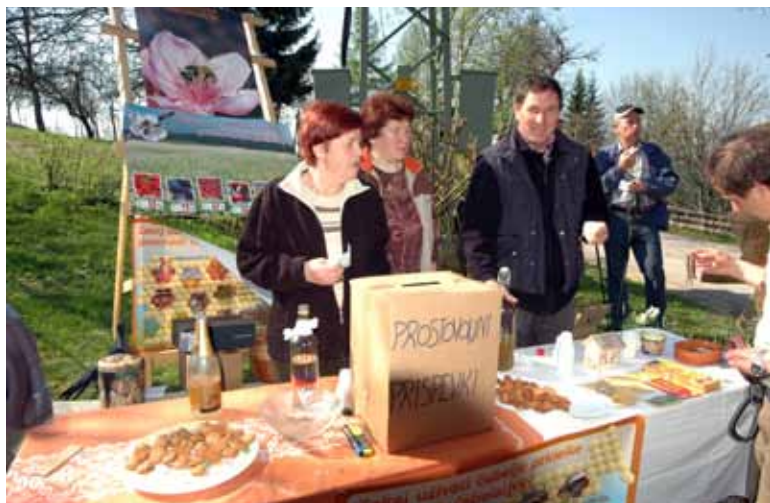
Čebelarška okrepčevalnica na Krpanovi poti