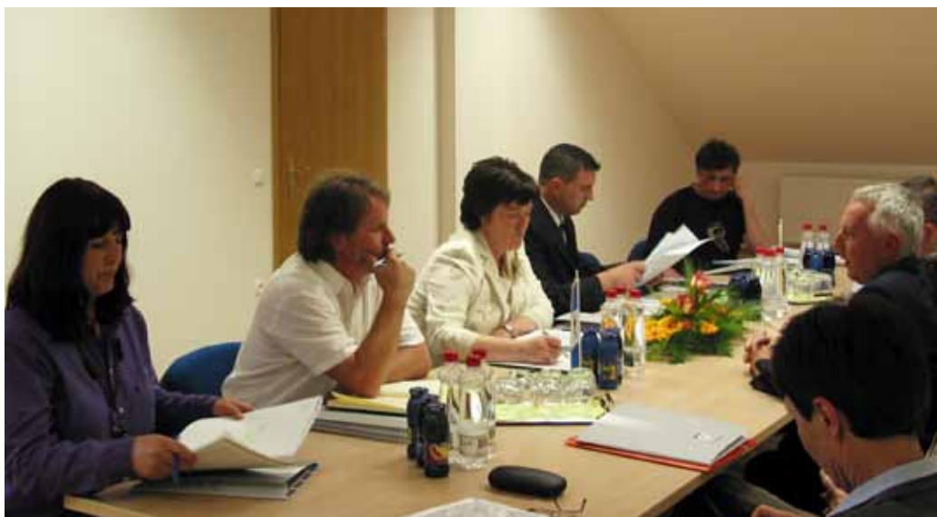
Župan v razgovoru s predstavniki Ministrstva za okolje in prostor

Zelo ploden in konkreten je bil tudi razgovor z delegacijo Ministrstva za promet pod vodstvom ministra g. Radovana Žerjava. V razgovoru smo se dotaknili predvsem pregleda predvidenih ukrepov na regionalnih cestah, ki potekajo preko naše občine. Za nadaljnji razvoj Blok je velikega pomena še hitrejša izvajanje posodobitve republiške ceste Unec–Žlebič, ki nosi oznako R212. Že letos naj bi prišlo do posodobitve cestnega odseka na relaciji Nova vas–Veliki Vrh v