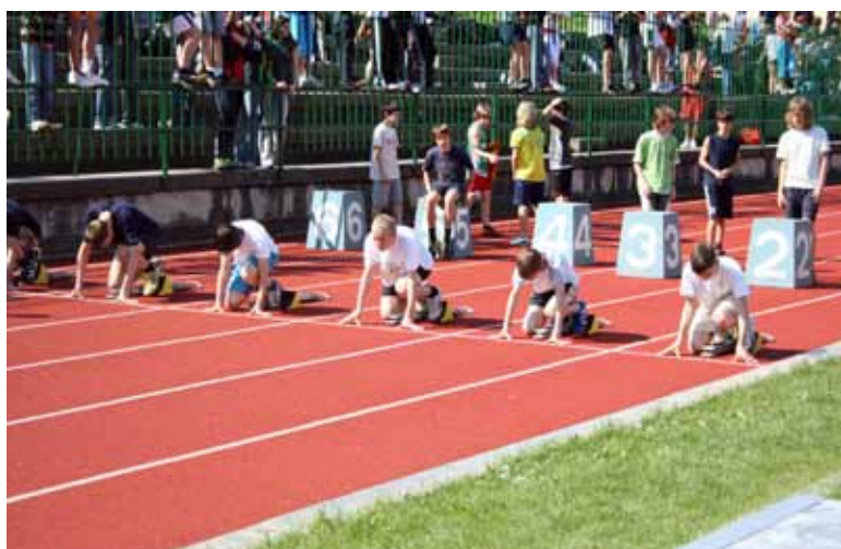
Tekmovali smo na atletskem tekmovanju v Postojni.