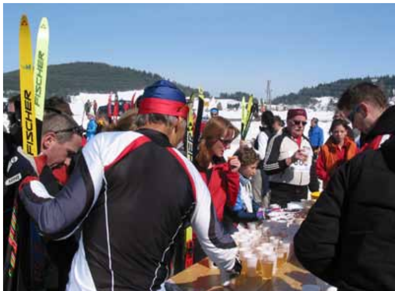
Okrepčilo se je privilego.