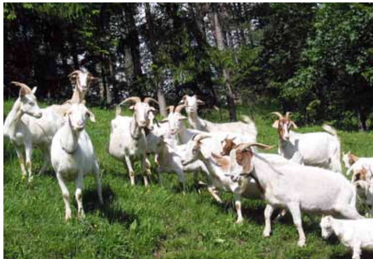
Koze na paši

V tem času se je v Sloveniji močno povečalo število rejcev ovc in koz in tudi število članov Zveze društev rejcev drobnice Slovenije se je stalno povečevalo. Ta se je kasneje