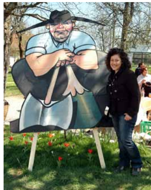
Mednarodna udeležba – dekle iz Bolgarije

V organizacijo prireditve pa sta se letos zelo lepo vključila tudi čebelarstvo društvo Bloke in Društvo rejcev malih živali Slivnica. Okrepčevalnica na Gradiškem, kjer so imeli bazo, je bila prava ponudba domače naravne hrane in tudi vzorčen primer, kako lahko sodelujejo v turistični ponud-