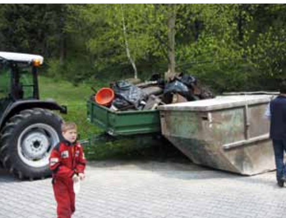
Dovoz so najmlajši budno spremljali.