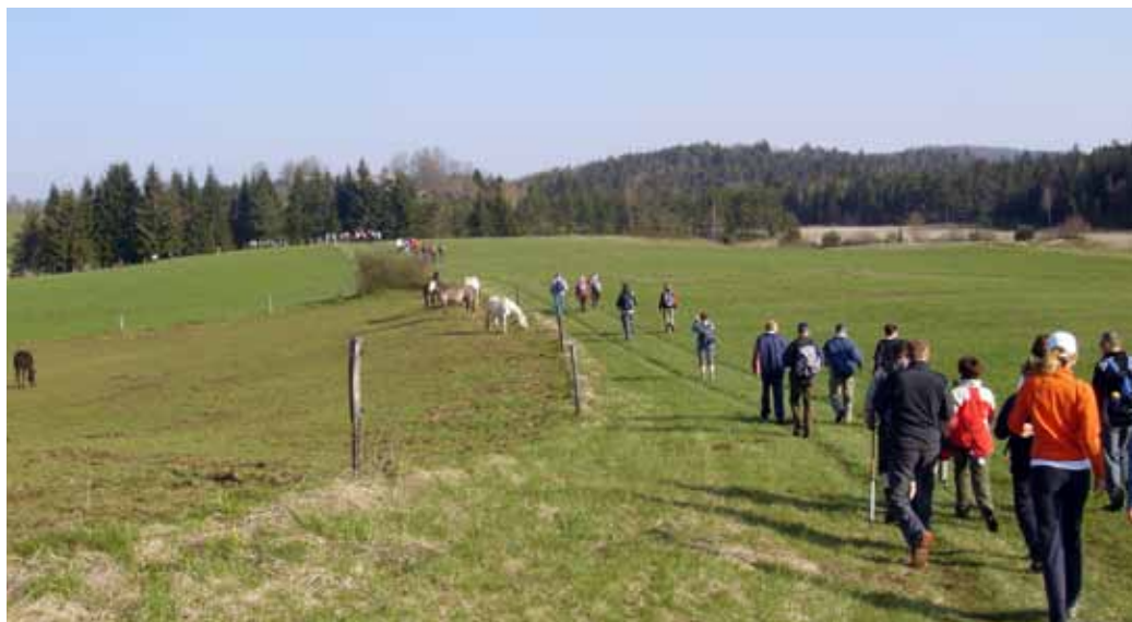
Panorama, da te kap!

bi kraja. Bloške gospodinje pa so ob poti in na cilju pripravile že tradicionalno prodajo domačih pekovskih dobrot. Pohvaliti pa moramo tudi ekipo novskih gasilcev, ki so poskrbeli, da se je promet na dokaj neugodnem parkirišču odvijal normalno in ni prišlo do prometnega infarkta. Vodiči turističnega društva so poskrbeli, da so blie cerkve in druge kulturne znamenitosti ob poti pohodnikom na voljo in ustrezno predstavljene.