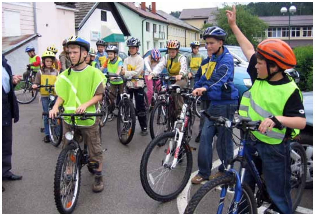
Vsi smo naredili kolesarski izpit.