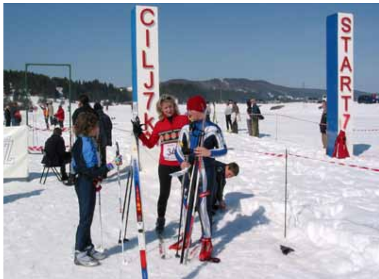
Najlepši del proge je cilj.