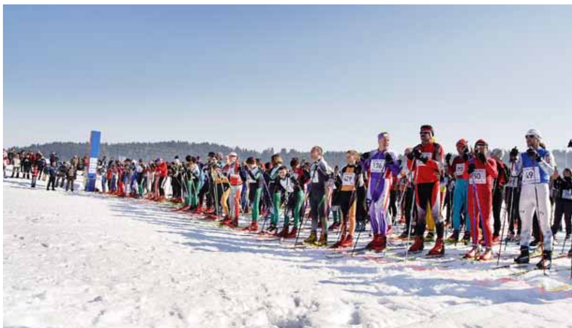
Na štartu je bilo napeto kot vselej.