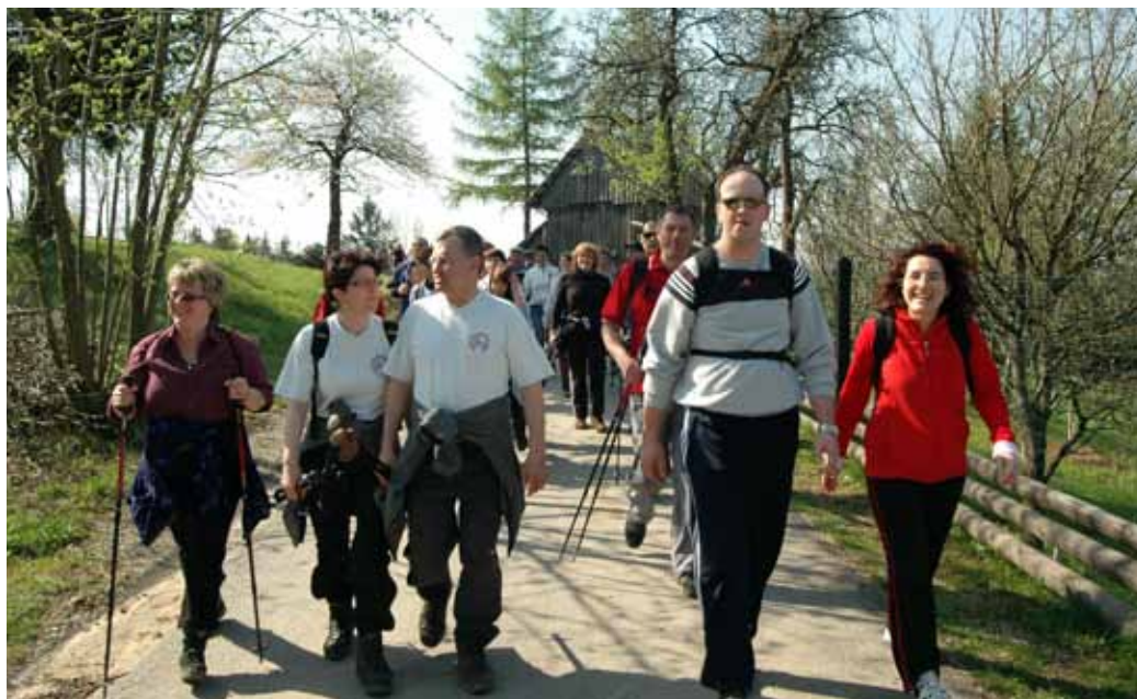
Zadovoljni pohodniki na Gradiškem

ZADNJO NEDELJO V APRILU SE JE NA KRPANOVO POT PODALO ZELO VELIKO OBISKOVALCEV. ORGANIZATOR JE PRIPRAVIL NEKAJ SPREMOMB, KI SO SE POKAZALE KOT DOBRE. OB UGODNEM VREMENU SO POHODNIKI UŽIVALI V PRELEPI NARAVI.