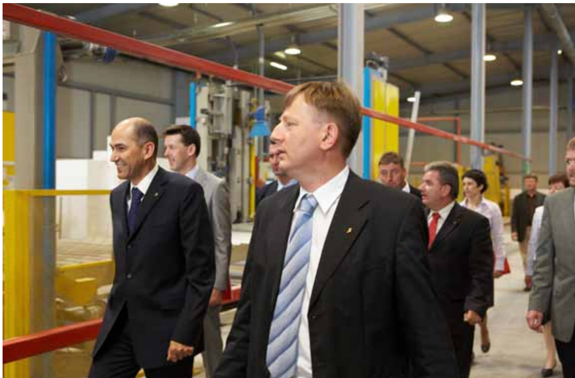
Na ogledu proizvodnega procesa