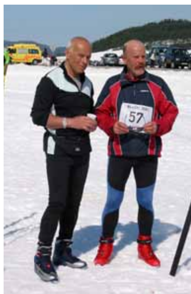
Sonce je prijetno grelo.