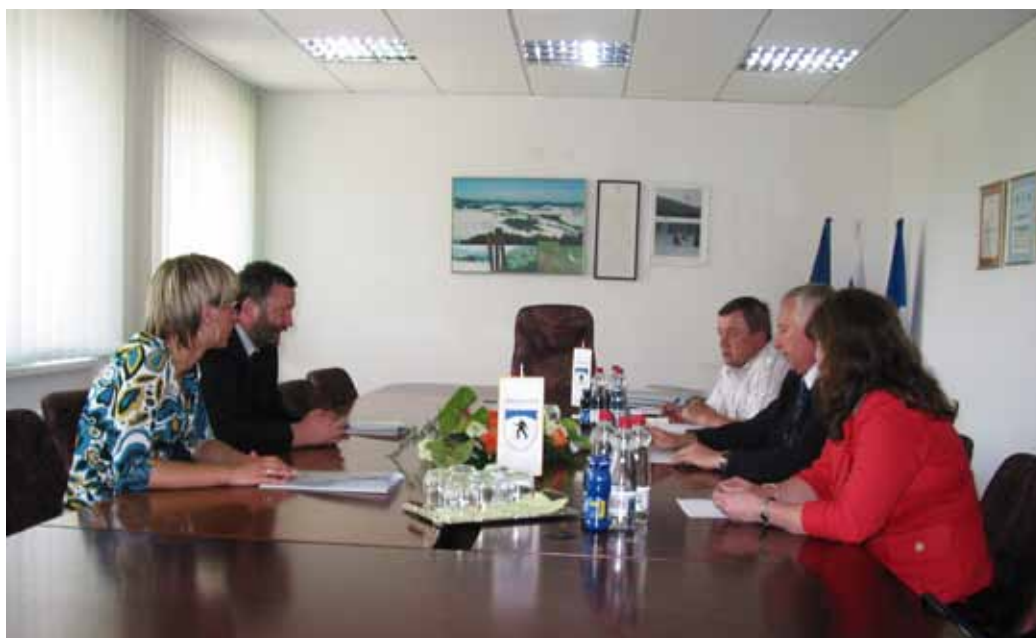
Minister za lokalno samoupravo Ivan Žagar je pokazal razumevanje za naše razvojne cilje.