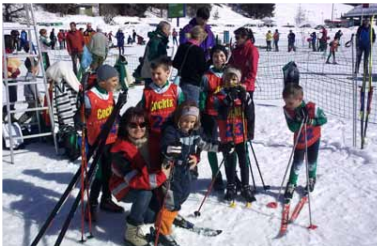
Čaj in nastavljanje soncu