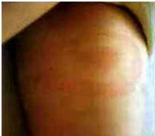
Značilni obročasti znak okužbe

Bolezen, ki jo največkrat imenujemo kar borelioz, je druga pomembna bolezen, katere