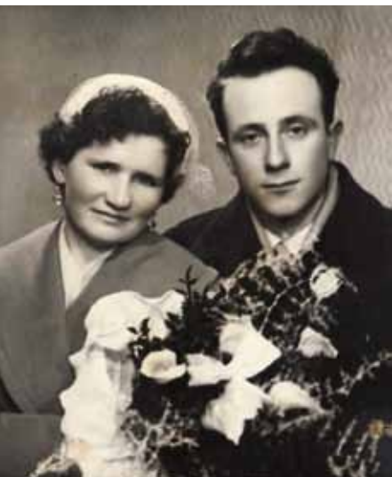
Mladoporočenca pred 50 leti

1. februarja 2009 sta v farni cerkvi pri Sv. Trojici zlatoporočenca ponovno izrekla poročne obljube