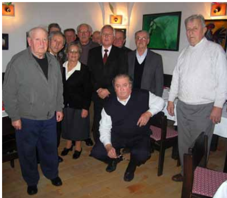
Slavljenici na praznovanju

Krajevna organizacija ZZB Bloke je pred novim letom organizirala srečanje ob 90-letnici in 80-letnicah svojih članov.