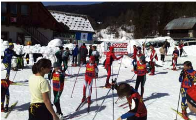
Priprava na tekmo pod bloško zastavo in Novolitovim transparentom

Blok, Sodražice, Loškega Potoka in Ljubljane je v čudovitem vremenu in prijetnem vzdušju izpeljalo tekmovanje, na katerem je sodelovalo 236 tekmovalcev iz 14 slovenskih in enega hrvaškega kluba. Razvrščeni so bili v 13 kategorij, tekmovali pa so v prosti tehniki s posamičnim startom in 30-sekund zamikom. Ta sistem tekmovanja zahteva visoko