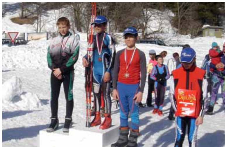
Zmagovalci na stopničkah: dve drugi mesti za organizatorja