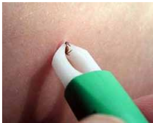
Pinceta za odstranjevanje klopov.

Klopi so paraziti toplokrvnih živali in ljudi. Glede domovanja niso izbirčni, najdemo jih tako v gozdovih kot tudi na travnikih. V naših krajih se najpogosteje srečamo z navadnim gozdnim klopom vrste Ixodes ricinus . Najbolj aktivni so spomladi in zgodaj poleti. V hladnih mesecih leta klopov ni, razen če je zima zelo topla in brez snega. Klop se najpogosteje prisesa na človeka na zadnji stra-