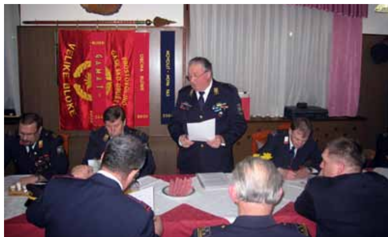
Delo na občnem zboru.