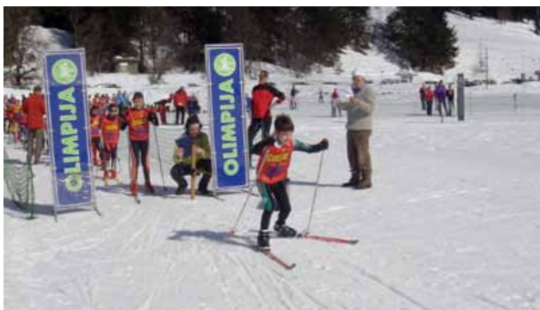
Vrsta pred tekmo in uspešen start