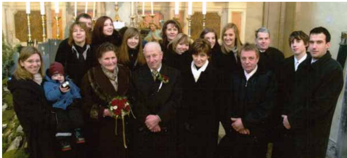
Slavljenca v družbi prijateljev in sorodnikov