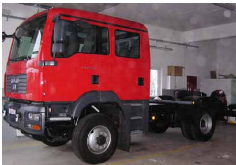
Gasilsko vozilo čaka nadgradnjo.