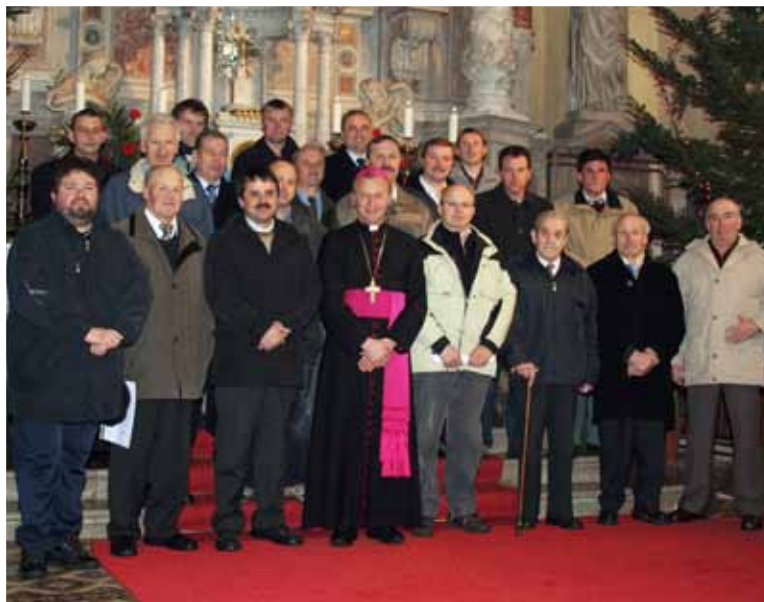
Novi in stari ključarji