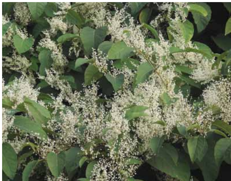
Japonski dresnik zraste do 3 metre visoko in tvori goste sestoje. Tako izpodrine vse domorodne rastline in spreminja življenjske razmere.