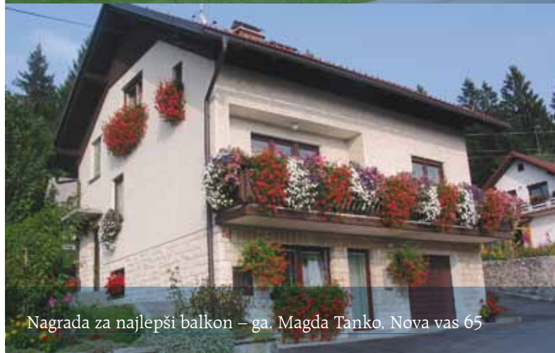
Nagrada za najlepši balkon – ga. Magda Tanko, Nova vas 65