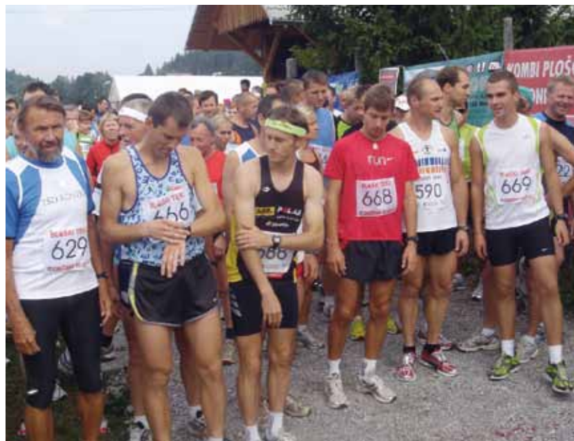
Tek po Blokah – eden izmed osmih tekov Notranjskega tekaškega pokala.

so prireditve večinoma pohanili. Svoje so k vzdušju dodali tudi navijači ob progi, ki so jih bili tekači še posebej veseli. S potekom prireditve smo zadovoljni tudi organizatorji. Ob tej priložnosti se iskreno zahvaljujemo vsem, ki so prireditve