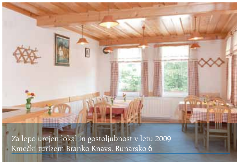
Za lepo urejen lokal in gostoljubnost v letu 2009 Kmečki turizem Branko Knavs, Runarsko 6