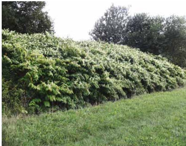
Japonski dresnik zelo hitro raste, a zacveti šele v poznem poletju.