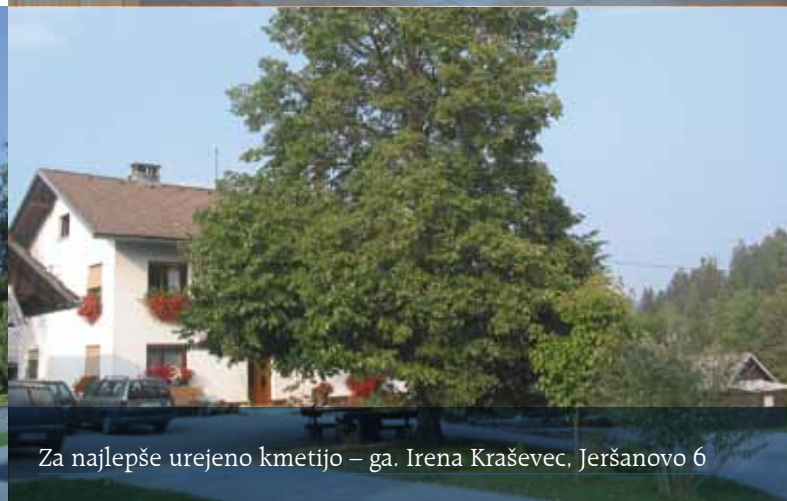
Za najlepše urejeno kmetijo – ga. Irena Kraševac, Jeršanovo 6