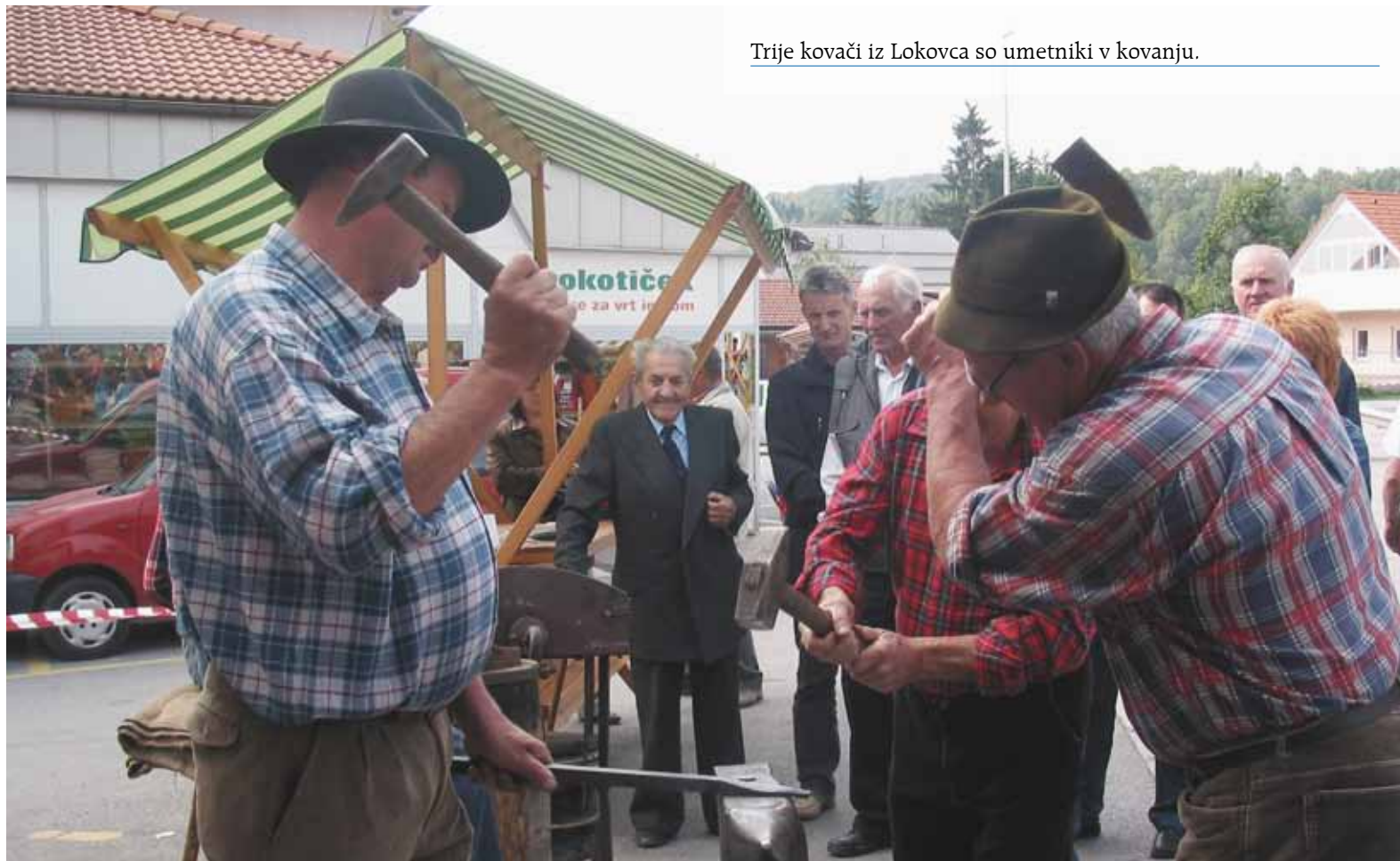
Trije kovači iz Lokovca so umetniki v kovanju.