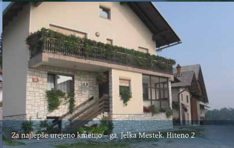
Za najlepše urejeno kmetijo – ga. Jelka Mestek, Hitenovo 2