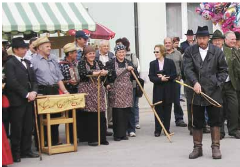
Bloški furman je tudi letos popival na Mihaelovem sejmu.