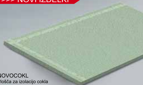
NOVOCKL Plošča za izolacijo cokla