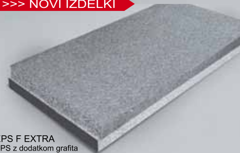
EPS F EXTRA EPS z dodatkom grafita