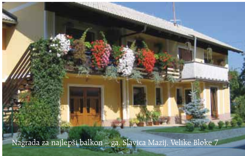
Nagrada za najlepši balkon – ga. Slavica Mazij, Velike Bloke 7