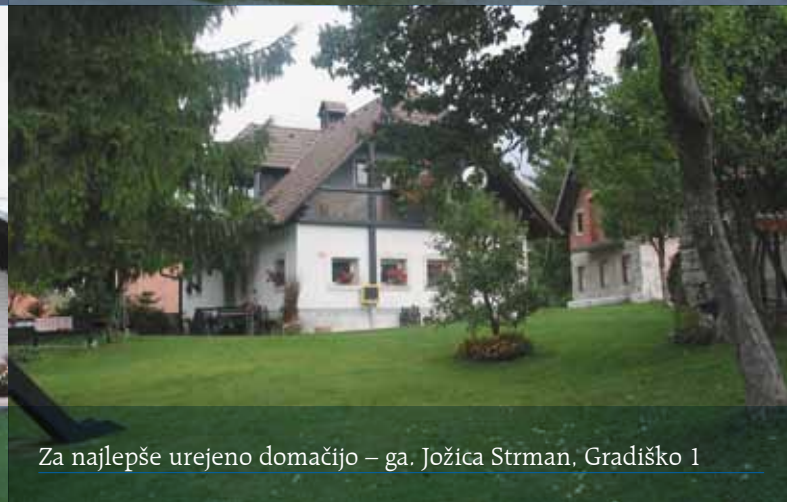
Za najlepše urejeno domačijo – ga. Jožica Strman, Gradiško 1