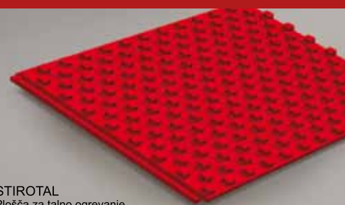
STIROTAL Plošča za talno ogrevanje

>>> CELOVITE REŠITVE NA PODROČJU TOPLOTNE IN ZVOČNE IZOLACIJE