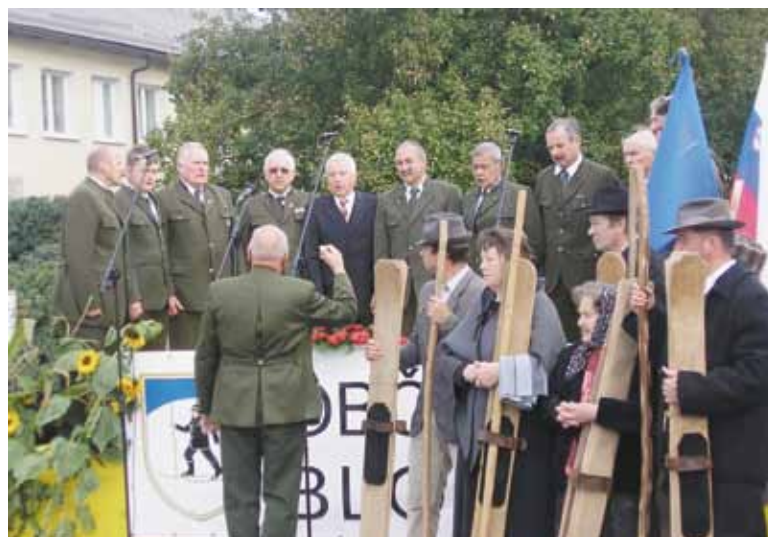
Lovski zbor in bloški smučarji so zaščitni znak sejma.