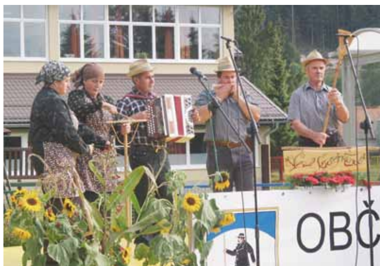
Na deščici v slovenščini piše: »Vesli gorenjkončani.«