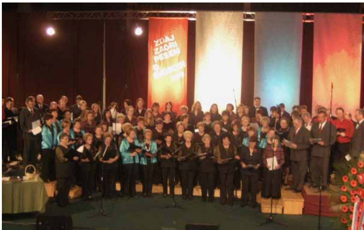
V sezoni 2008/09 smo nanizali kar nekaj uspešnih nastopov.

Navzoči so bili navdušeni nad podobo Bloške planote, po drugi strani pa kar malo zaskrbljeni, saj bo struktura tal in rastja ter razgibanost terena zahtevala od pssov vrhunsko pripravljenost. Prisotne je zanimal tudi prevoz do sledi, najtežje pa je bilo odgovoriti na vprašanje o klimi in vre-