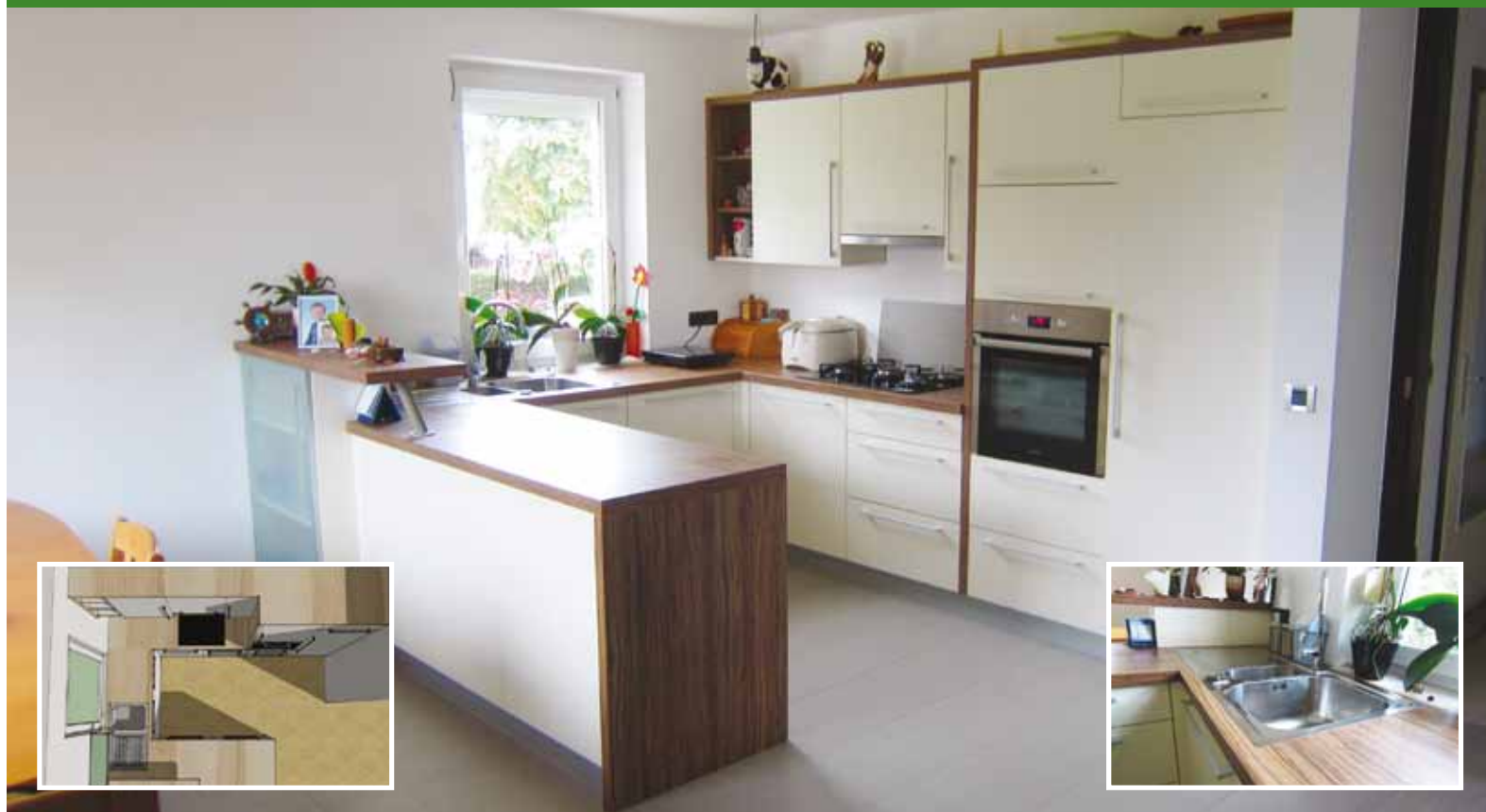
Kuhinja NK · Izdelujemo pohištvo za vse bivalne prostore.