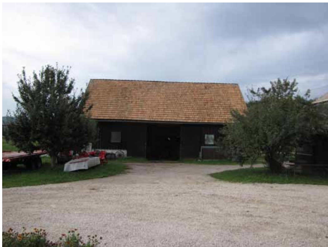
Prva začasna streha za jadralna letala v Novi vasi, nekdanj imenovan Lahov magacin po takratnem lastniku – veleposestniku Modicu z Lahovega