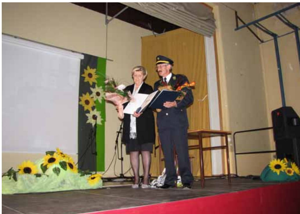
Prejemnika priznanja občine Bloke

Pri svojem delu je znala prisluhniti slehernemu posamezniku, se redno strokovno dopolnjevala in to omogočala tudi svo-