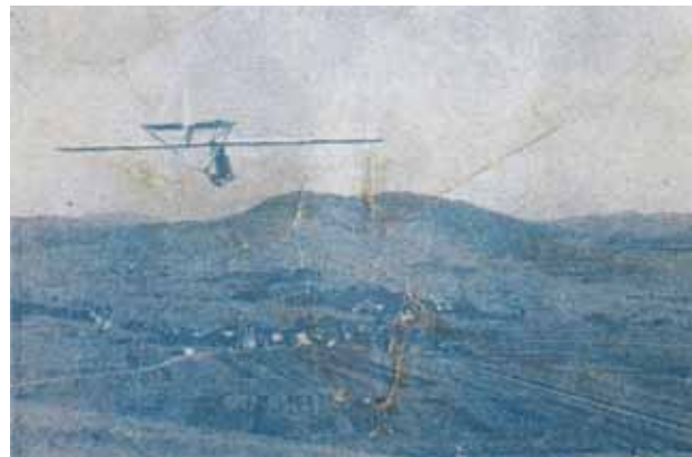
Začetniško letalo tipa »Zöling« v letu v smeri na Novo vas. Start z »B« terena vrh Bradatke

Prva leta so jadralci letala shranjevali v Novi vasi pod velikim skednjem, ki še vedno stoji za Zupančičevo hišo (Ranč Bloke). Nato so jih nekaj let imeli pod velikim vojaškim šotorom na prostoru za sedanjo osnovno šolo. Tu so zgradili manjšo barako, kjer je bila kuhinja in jedil-