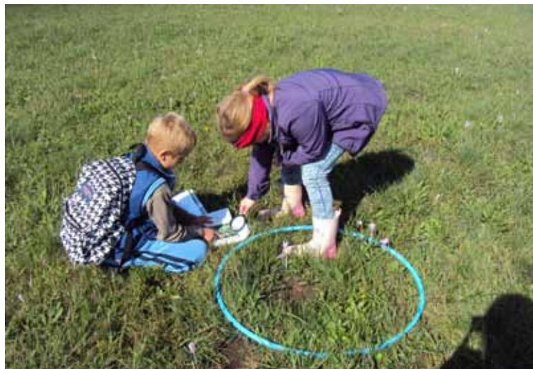
Vidiš, Zarja, to je ta rastlina.

Zgradbo travniških rastlin, ki smo jih opazovali, smo tudi narisali in poimenovali. Ugotovili smo, da se posamezni deli med seboj razlikujejo po velikosti, barvi in obliki.