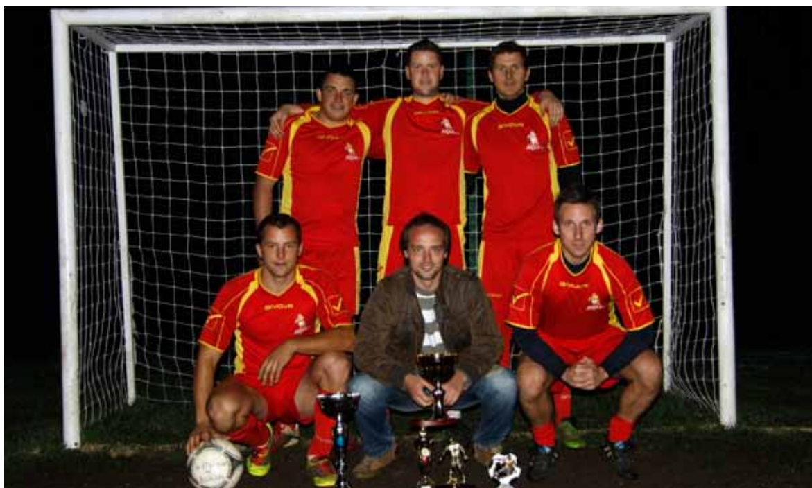
Zmagovalna ekipa Okrepčevalnice Lovec