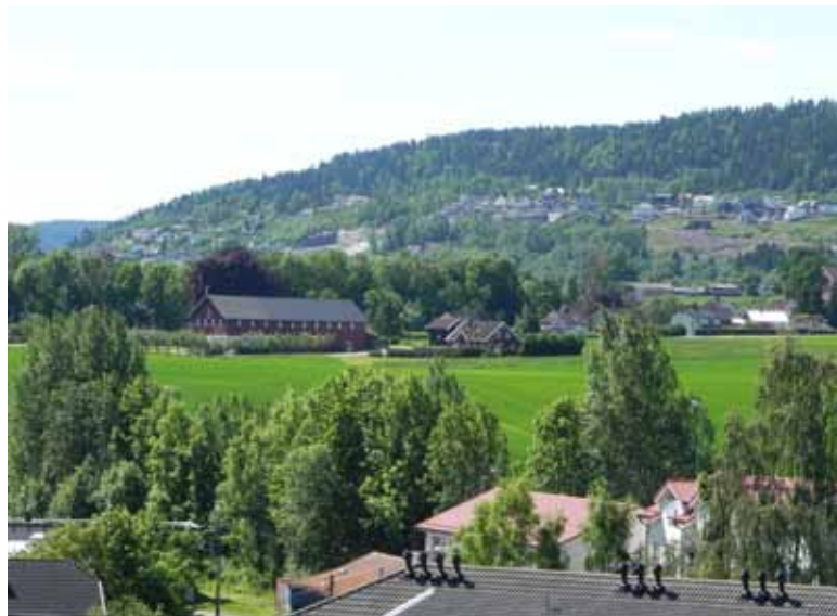
Tipična norveška pokrajina – občina Lier

likovanju nove razvojne vizije Notranjsko-kraške regije, ki temelji na trajnostnem razvoju ter sožitju narave in človeka. Ob že vzpostavljeni strategiji razvoja regije in novi krovni znamki Zeleni kras, ki služi že 60-im registriranim uporabnikom, so občine investirale v opremljanje regijskih turistično-informativnih točk, izobraževanje delavcev v turizmu, turističnih vodičev in imetnikov znamk, v pripravo promocijskih materialov, filmov in ostalih promocijskih aktivnosti. Prav tako so občine ob podpori razvojne agencije začele izvajati skupne ukrepe na področju ravnanja z odpadki in spodbujan-