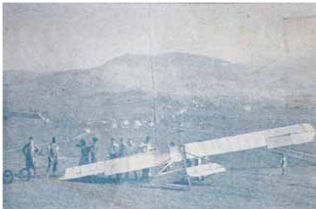
Pred startom brezmotorne letala »Zöling« z vrha Bradatke

Čez 2 leti bo minilo osmdeset let, ko se je na Blokah začelo šolanje letalcev na jadralnih letalih. Prvi jadralci, pravzaprav šele »šolarji« za pilote jadralnega letala, so prišli na Bloke leta 1934. Tega leta je bil ustanovljen Aeroklub v Ljubljani, v avgustu pa je bilo odprto tudi novo letališče v Polju pri Ljubljani. V tem času so se prvi bodoči letalci že učili na Blokah prvih »korakov v zraku«.