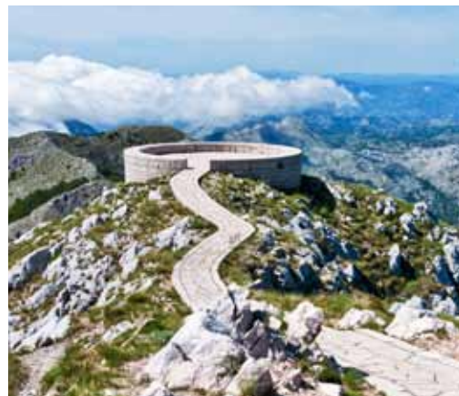
Razgledna točka na Lovčenu, od koder se vidi vso Črno goro.

so črna gradnja (le katera pa niso, smo se na koncu spraševali), pa tudi oddajajo se na črno, česar pa nismo vedeli. Pod večer se je namreč do nas pripeljala luštna inšpektorica s pravo »FBI-jevsko« identifikacijo in nas spraševala,