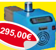
PELETNI GORILEC Blotermec 10 - 50 kw