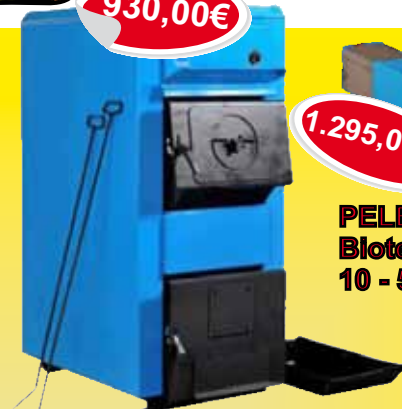
KOTEL SCHMIT TKU 3 25 kw