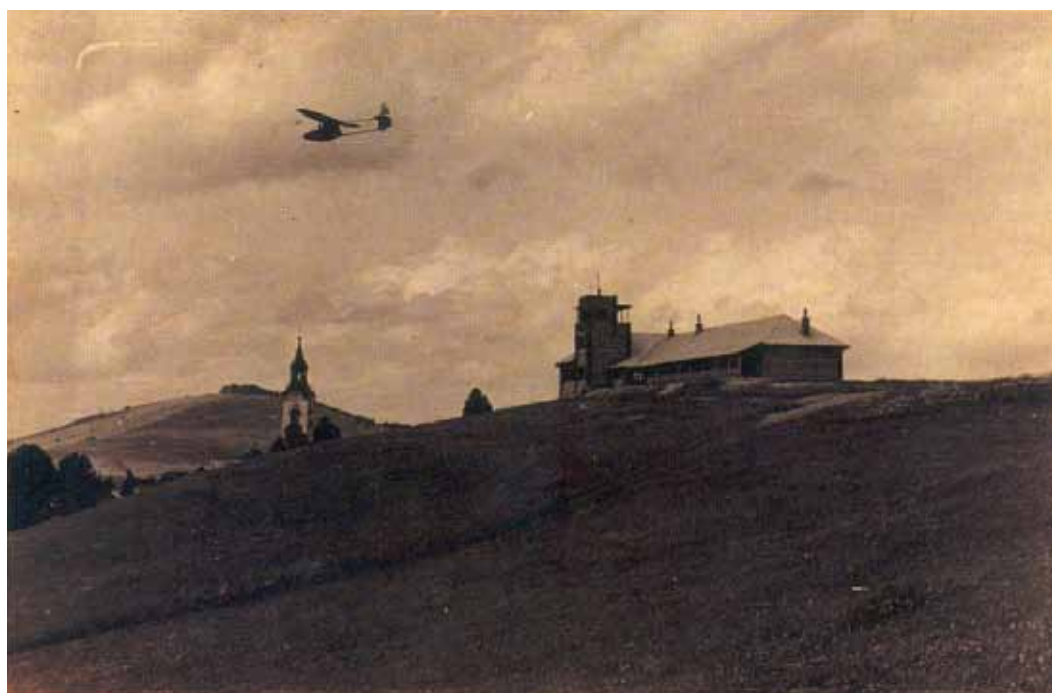
Hangar na Vidmu pri Fari leta 1936 in nad njim jadralno letalo tipa »Salamandra«