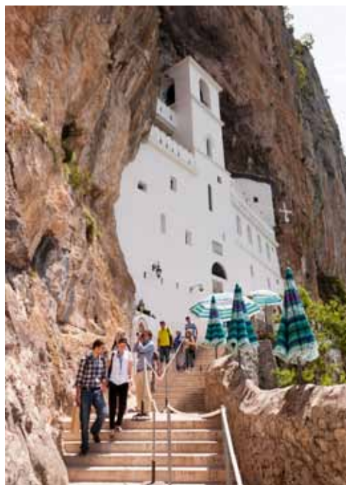
Samostan Ostrog, vklesan v skalnato steno – pomembno romarsko središče, kamor se zgrinjajo romarji z vsega sveta.

Žabljak – Plužine, saj je panorama preprosto osupljiva. Seveda pa tu spet ni vse tako, kot se kaže. Za širše področje narodnega parka so pripravili odličen načrt razvoja Masterplan 2020, ki opredeljuje smeri trajnostnega razvoja – načrt se odlično pogloblja v vsa področja od nastanitvenih kapacitet, urbanizma, trženja, ravnanja z odpadki do vključenosti lokalnih prebivalcev. Vsi obiskovalci Žabljaka, ki je turistično središče, boste hitro opazili, da nekaj ni v redu, in še kako prav imate. Naselja so raztresena povsod brez reda in vsak gradi po svoje – črne gradnje. Tega se v turistični organizaciji tudi zavedajo, a spet – ni ljudi, ki bi se s tem ukvarjali. Zanimivo je, da smo za skupino rezervirali prenočišča v objektih, ki