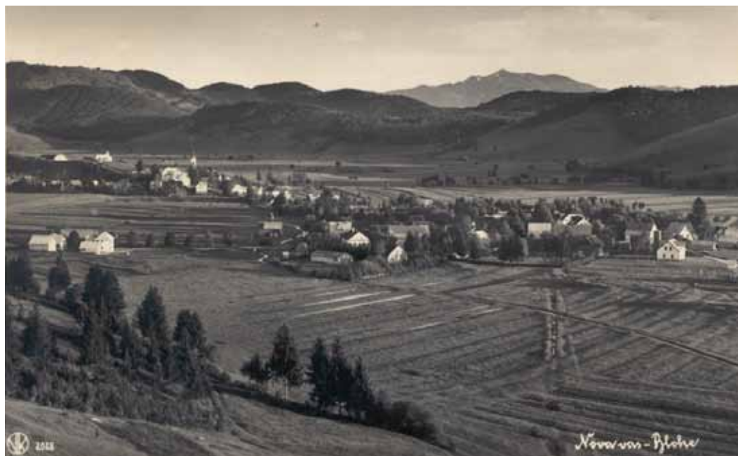
Razglednica Nove vasi l. 1940, v ozadju pobočja »plešastega« Županščka in gola pobočja Stražnic, Pečnika in Piškovca.