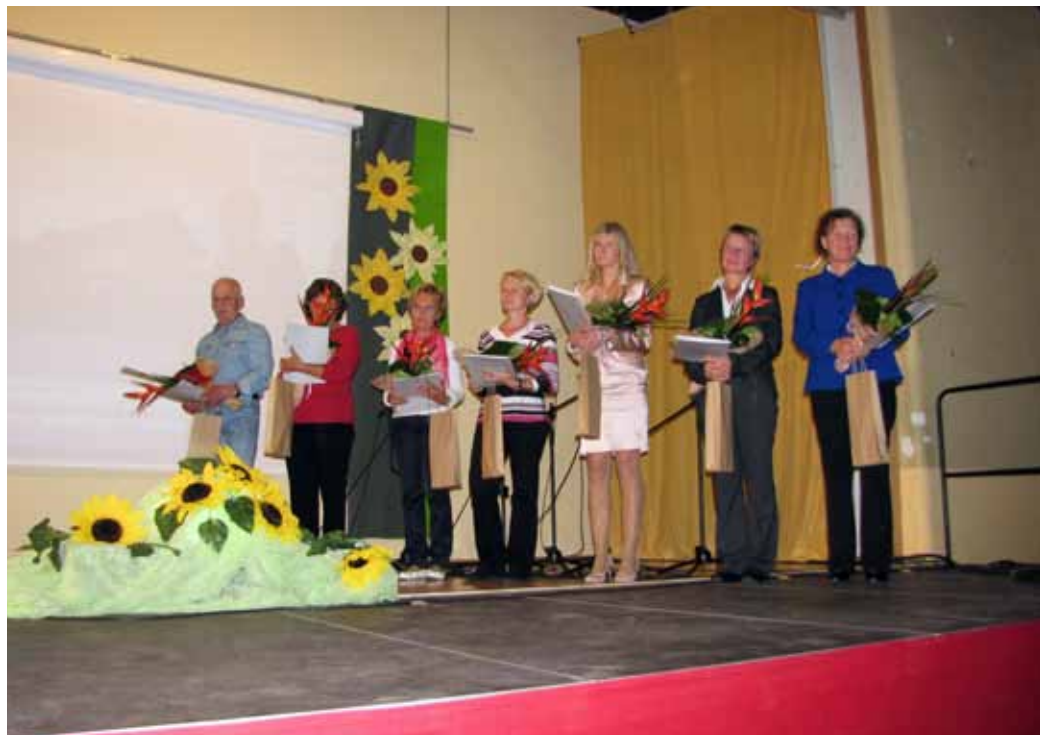
Nagrajenci akcije Na Blokah je lepo

Podelitev priznanj občine Bloke sva sprem- ljala, napisala in fotografirala: Tone Urbas in Stane Jakopin