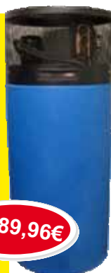
TOPLLOTNA ČRPALKA Tehnohlad 300 L