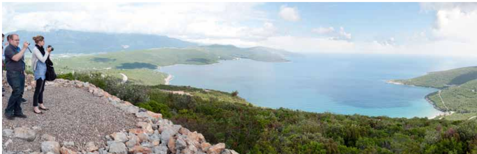
Panoramski posnetek kraja, kjer bo zraslo novo mesto za deset tisoč prebivalcev.