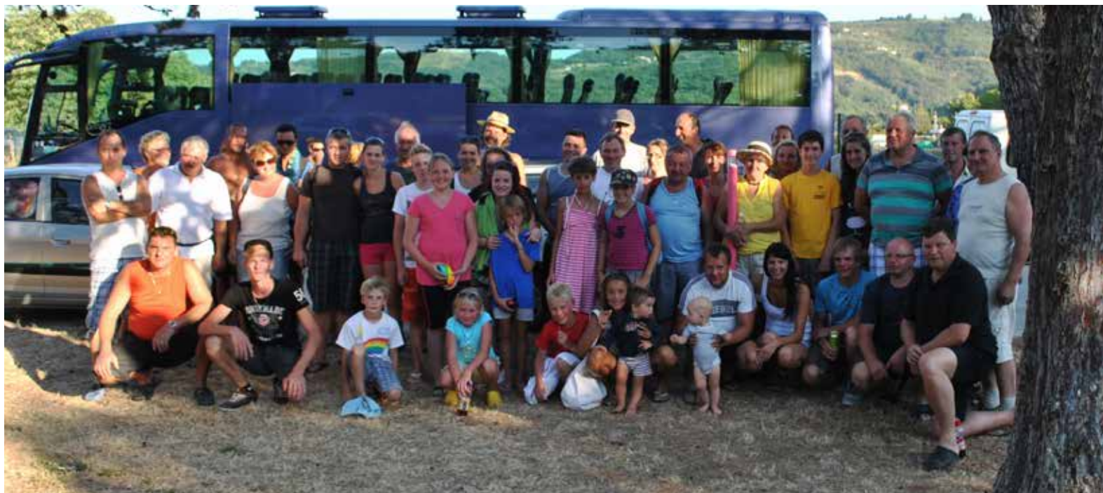
Skupaj veselo razpoloženi od najmlajših do veteranov

Ob letošnjem volilnem občnem zboru PGD Velike Bloke smo zapisali zavezo novega vodstva, da bo nadaljevalo z uspešnim vsestranskim razvojem društva in črpalo iz pozitivnih izkušenj dosedanjih vodilnih pod vodstvom sedanjega častnega predsed-