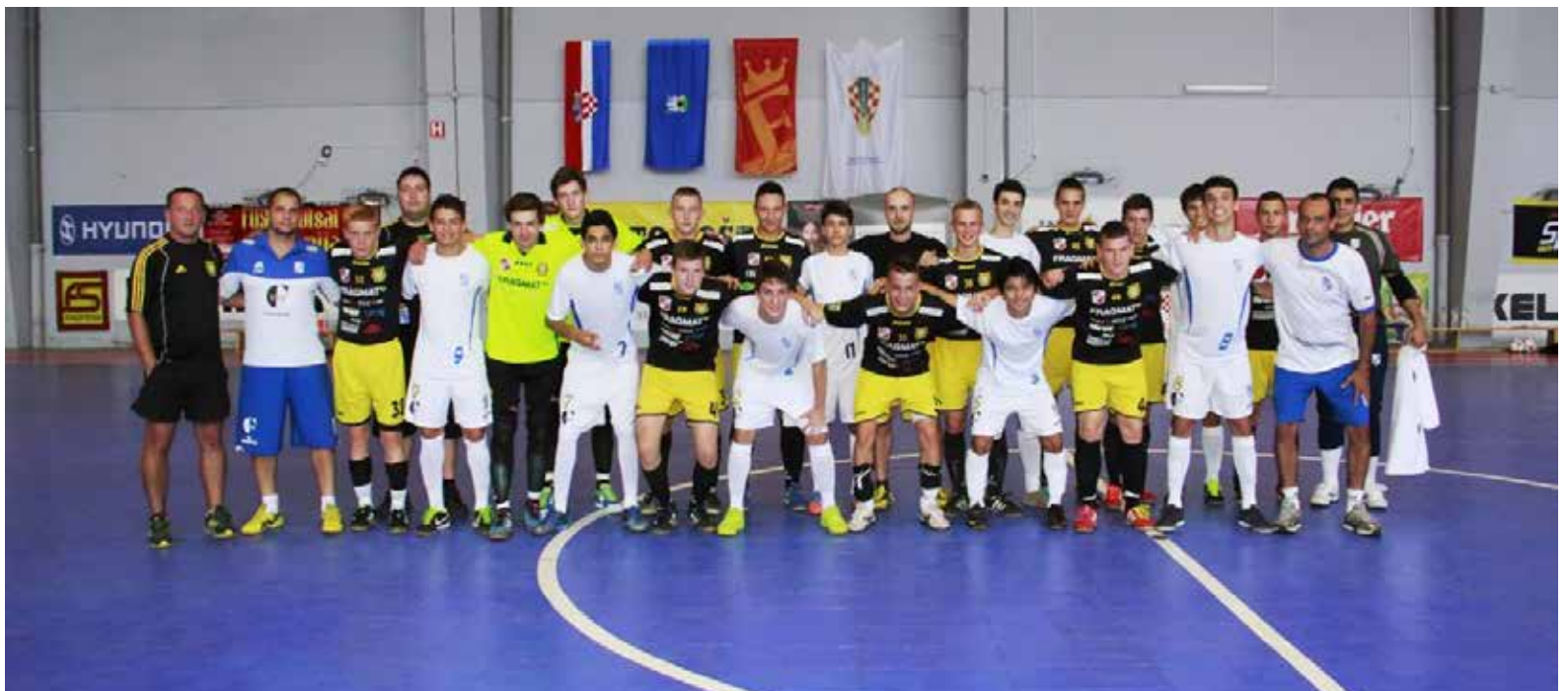
Ekipa U17 skupaj z Brazilci s turnirja v Zagrebu