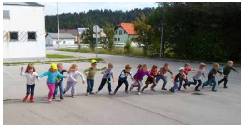
Skupina Murenčki smo »štartali« v novo šolsko leto.