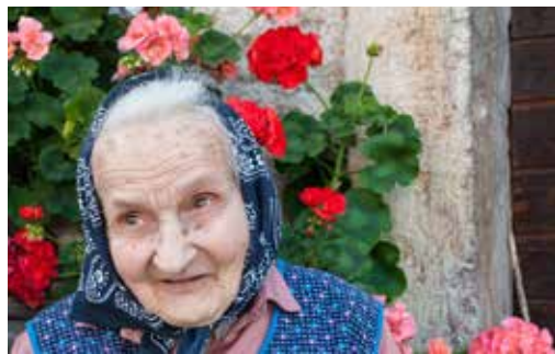
Rože me držijo pokonci.

Imela sta dve hčerki, zdaj pa ima že pet vnukov. »Hčerki skrbita zame več kot odlično, vsi so pridni. Včasih pravim, da vnuke še preveč priganjajo, ker vedno toliko delajo, ampak mi povejo, da so sem in tja tudi kaj prosti.«