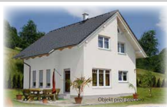
Objekt pred prenovno.

Želimo, da bi z ugodnostmi, ki jih nudimo občanom občine Bloke prispevali k urejenosti kraja.